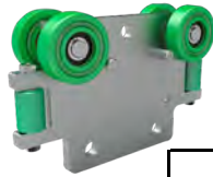
Trolley de Carga