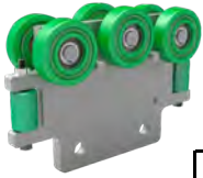
Trolley de Reacción